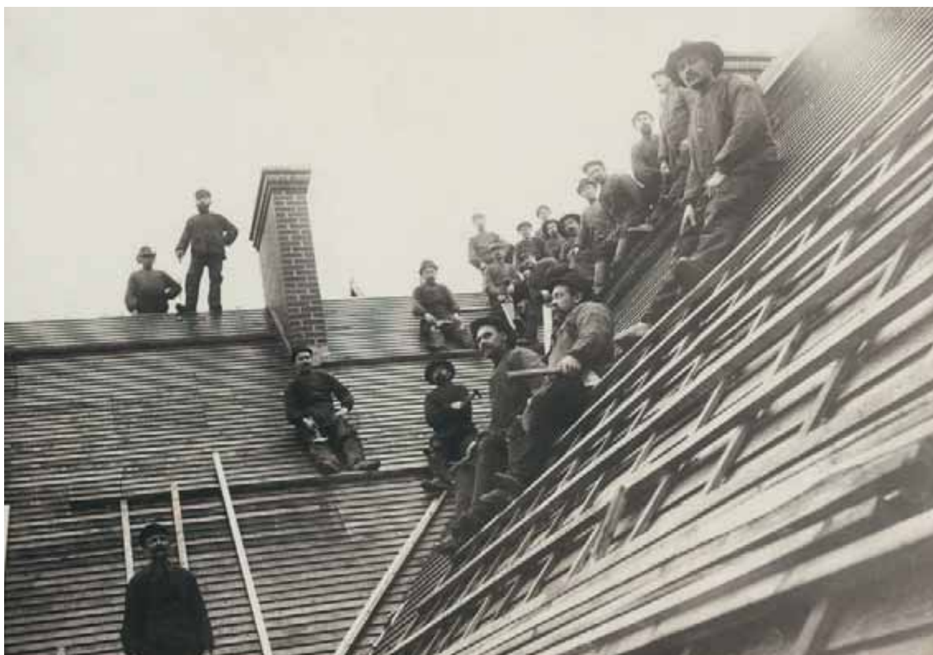
Byggarbetsplats i början av 1900-talet.