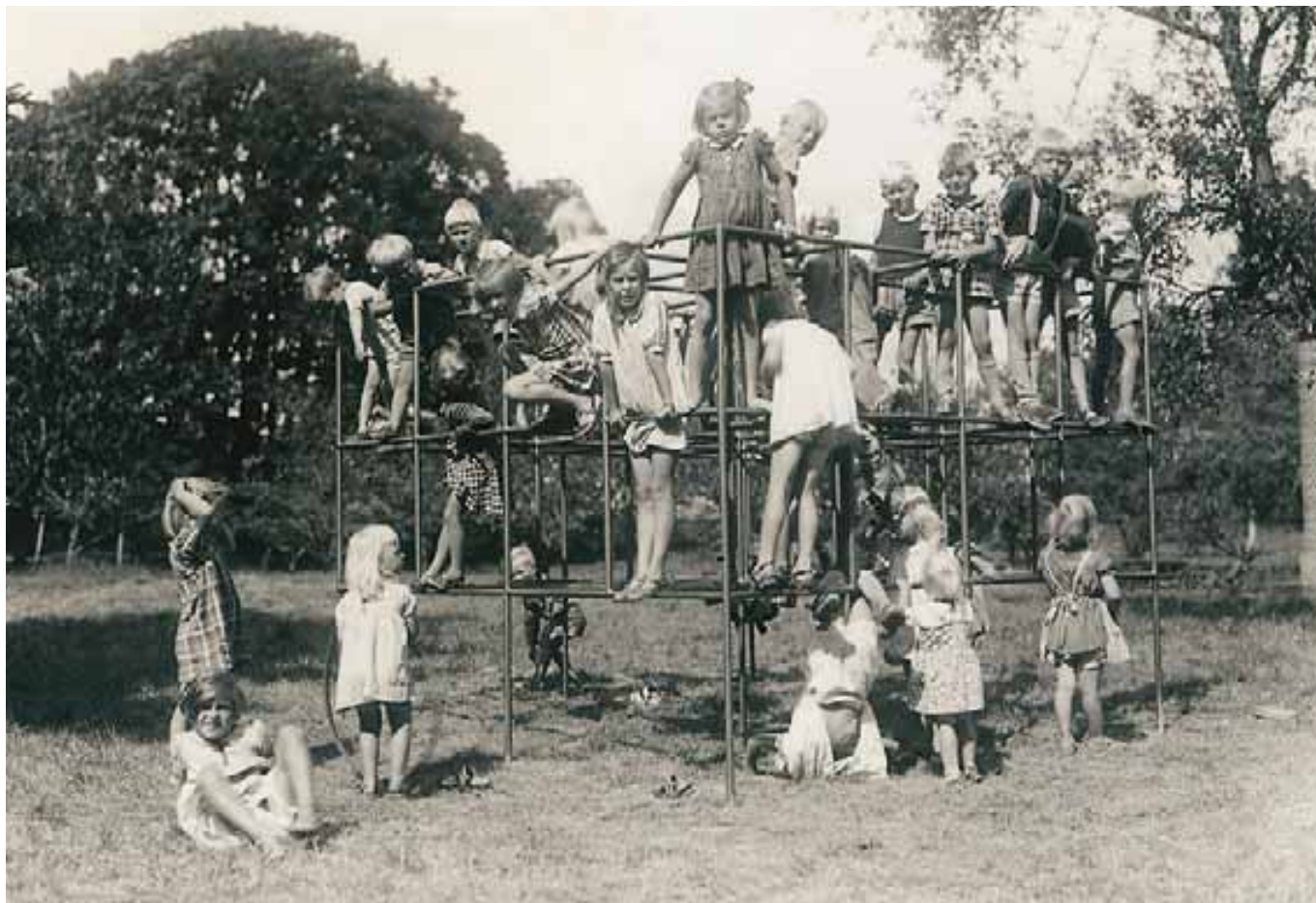
Barn på koloni.