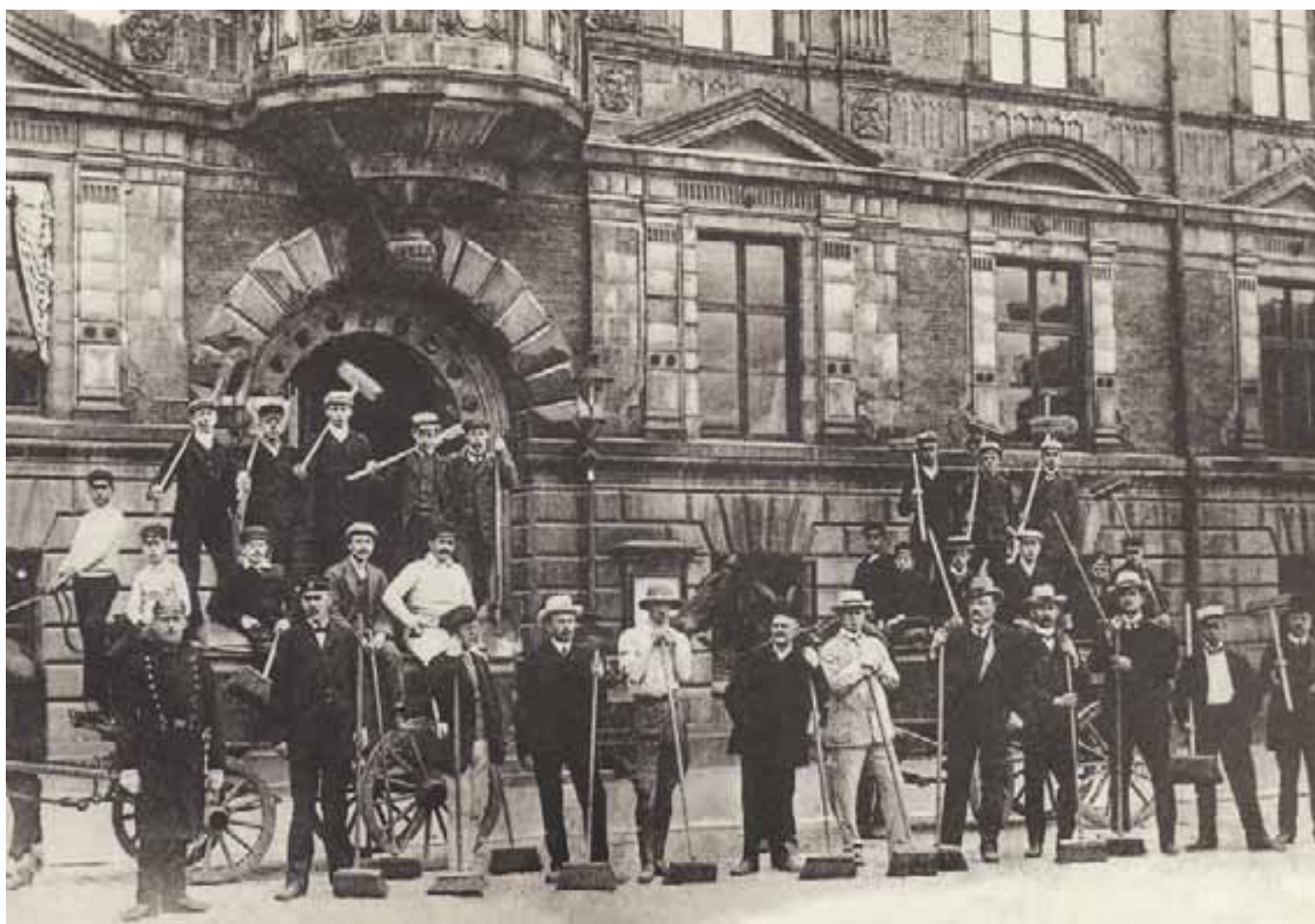
Kommunarbetarestrejken i Malmö 1908.