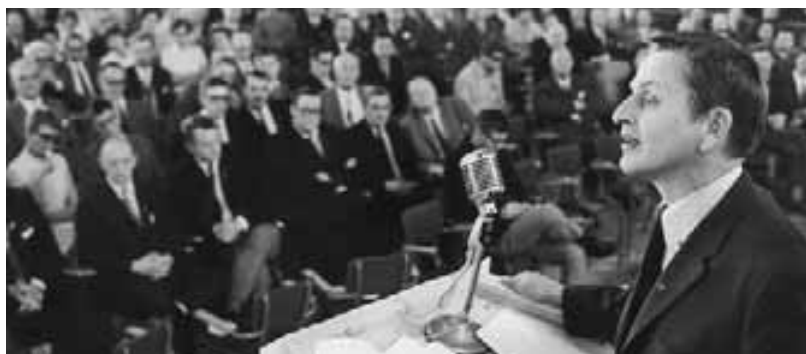
Malmö FCO konferensen. "Ökad jämnlighet – Val 79". Statsrådet Olof Palme 20 september 1969.