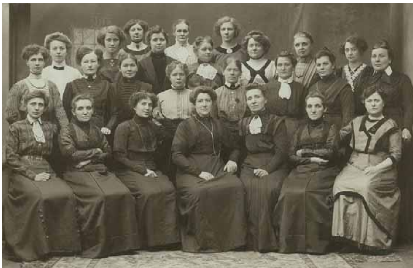
Medlemmar i Social Demokratiska Kvinnoklubben Malmö 1911.