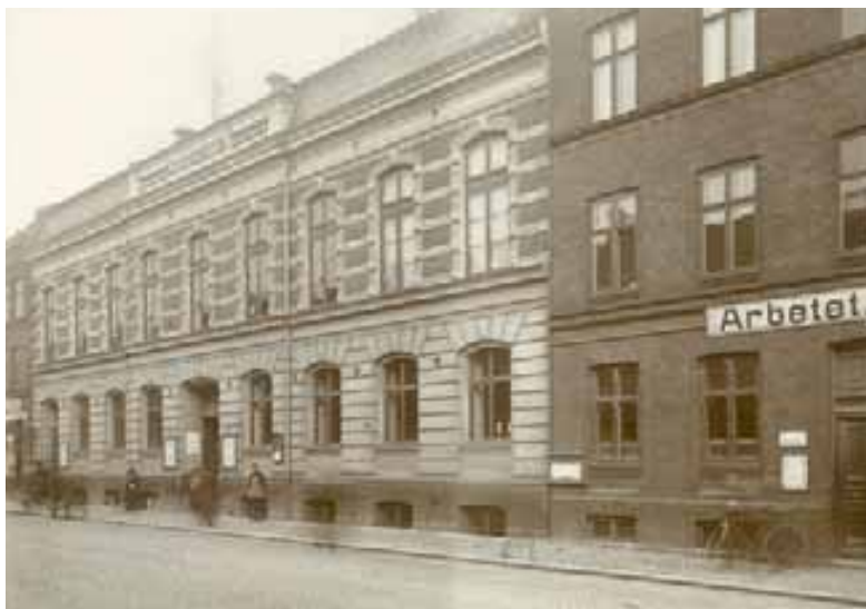
Gamla Folkets Hus i Malmö.

Organisationer: 104 Enskilda medlemmar: 93