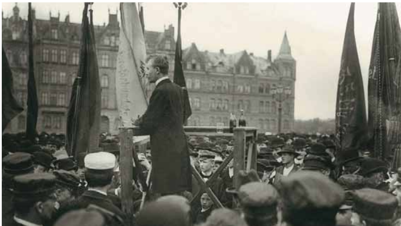
Bengt Lidforss talar 1 maj i Lund 1905.