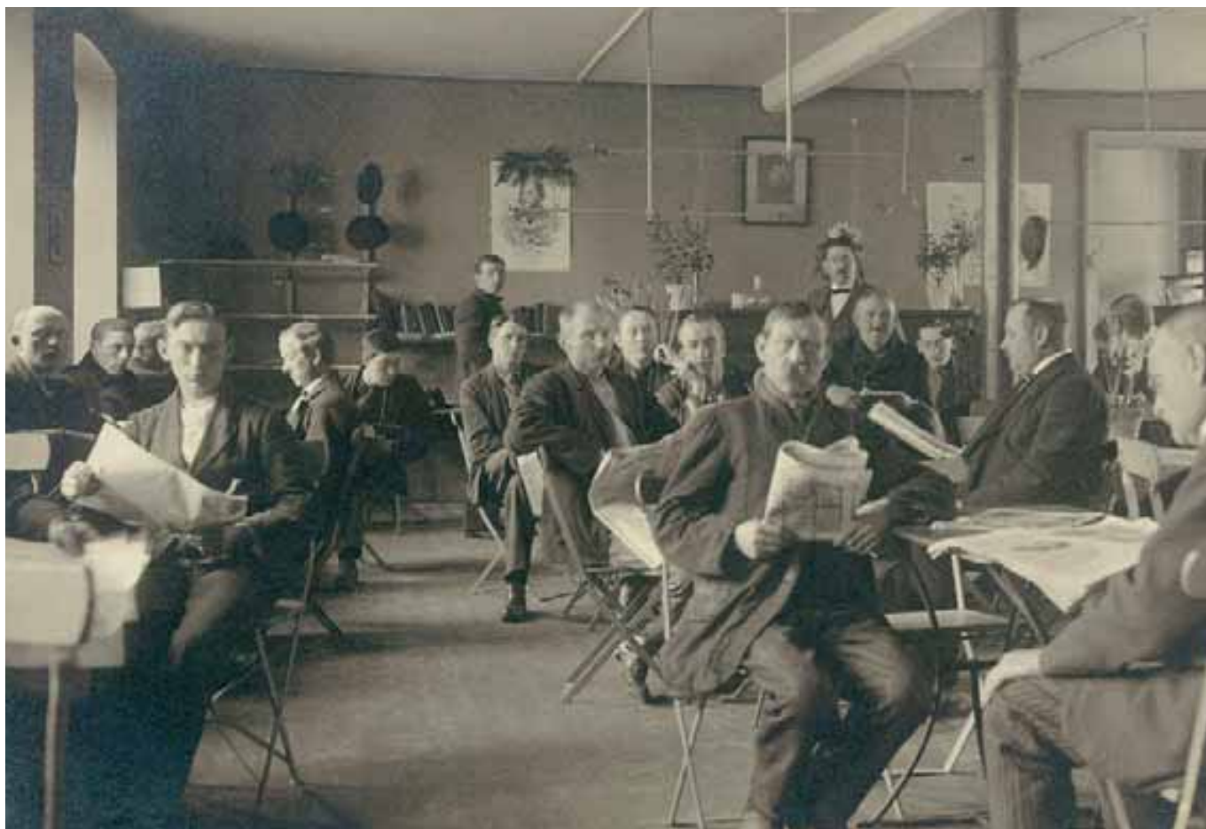
ABF:s läsestuga & Monbijouskolan, Malmö 1922.